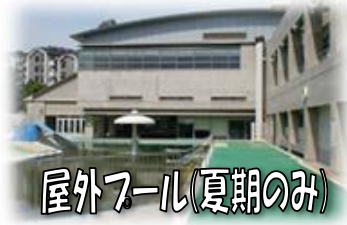
屋外プール(夏期のみ)