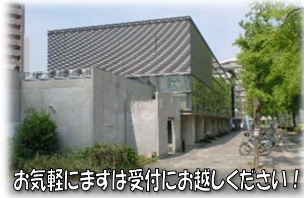
お気軽にまずは受付にお越しください！

からだ か きも か あたら しぶん 体を変える！気持ちを変える！新しい自分になる！ そんなあなたを全力でサポートさせていただきます。 はじ きも しもふくしま 始める気持ちは、下福島プールにおまかせください。