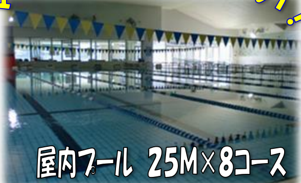
屋内プール 25M×8コース