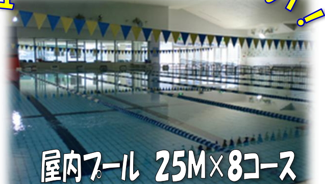
屋内プール 25M×8コース