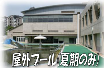
屋外プール(夏期のみ)