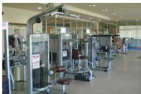
不明な点はインストラクターが丁寧にサポートさせていただきます。