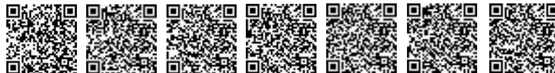
月曜教室 火曜教室 水曜教室 木曜教室 金曜教室 土曜教室 日曜教室