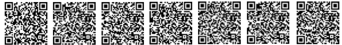
月曜教室 火曜教室 水曜教室 木曜教室 金曜教室 土曜教室 日曜教室