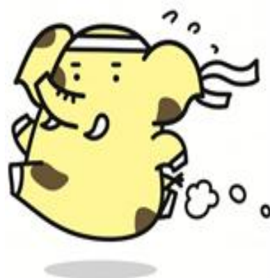
新座市イメージキャラクター ゾウキリン