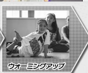
ウォーミングアップ