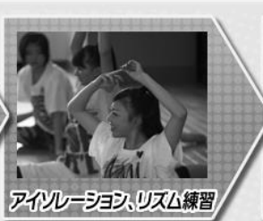
アイソレーション、リズム練習