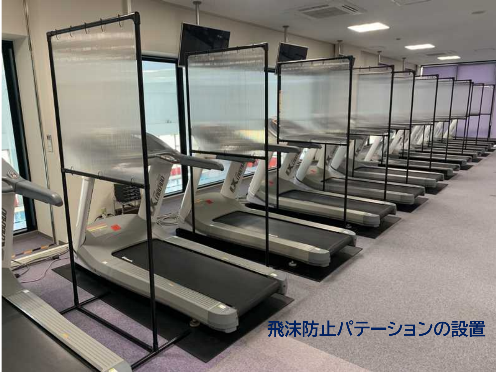
飛沫防止パテーションの設置