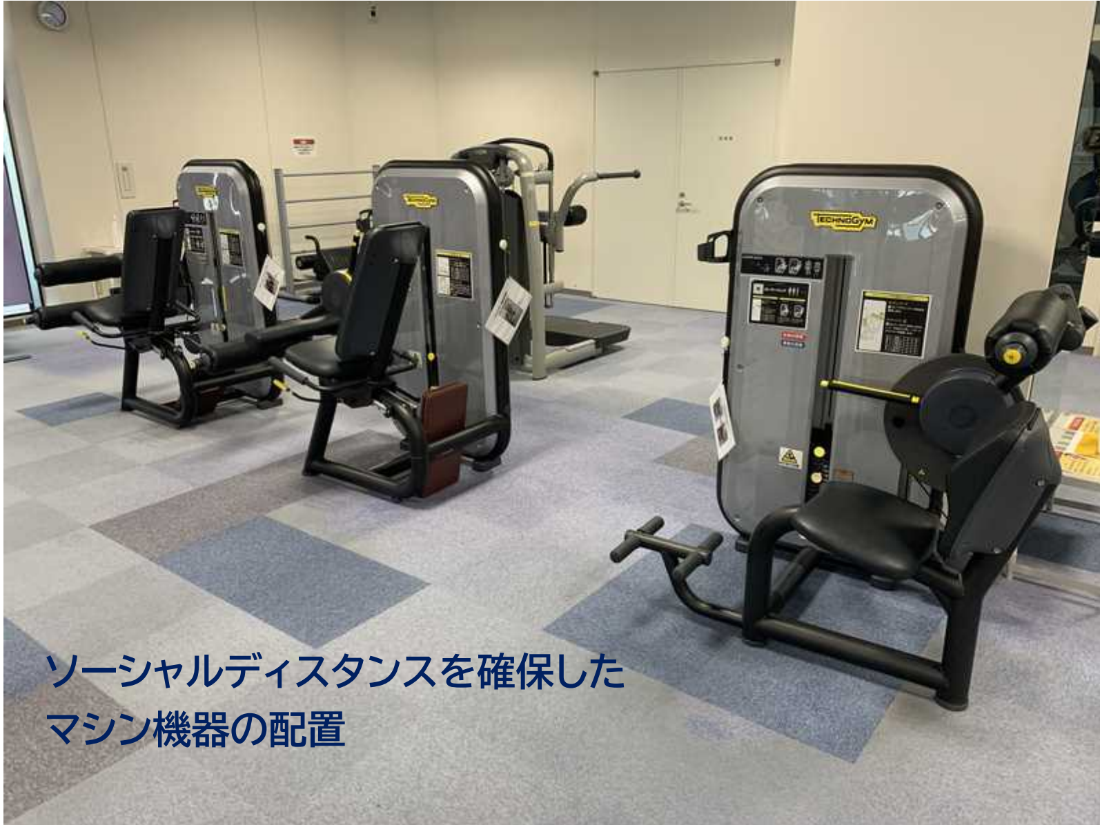
ソーシャルディスタンスを確保した マシン機器の配置