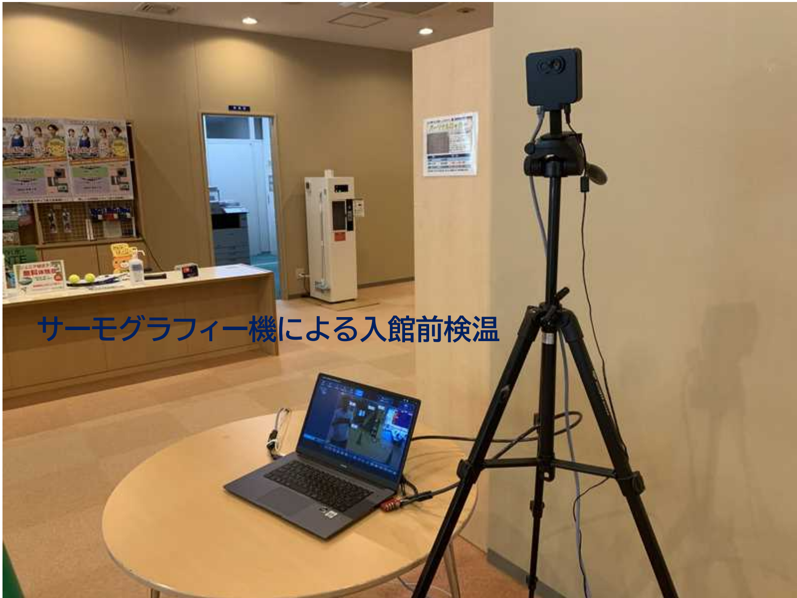
サーモグラフィー機による入館前検温