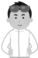
※ラッシュガードについて

保護者の方へ 着用は可能ですが、お子様にとって泳 ぎにくくなります。また、冬場はプールか ら帰る際に気化熱の兼ね合いで逆に 寒くなりますのでご注意ください。