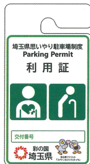
その他の高齢者、 障害者等用