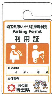
妊産婦、 けが人等用